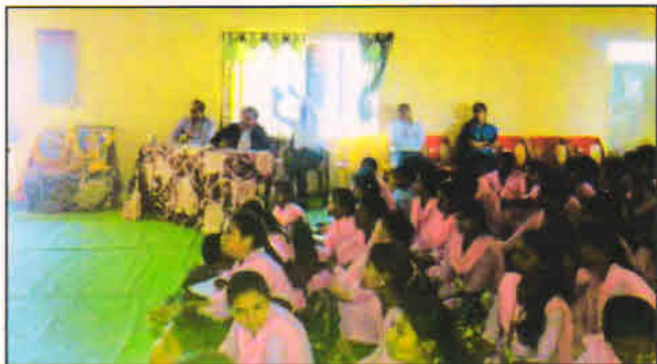
Students present for the presentation competition