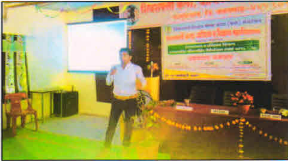
Participant student presenting his presentation